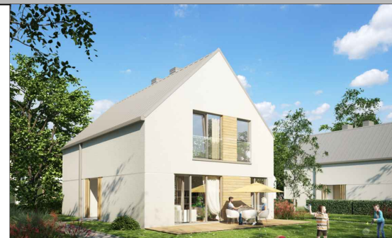
UL. MYŚLIWSKA, ŁOCHÓW