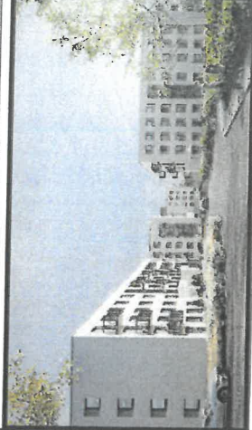
SCHEMAT BUDYNKU "L"

INWENTARYZACJA POWYKONAWCZA ul. Kazimierza Kamińskiego 22B 05-850 Ożarów Mazowiecki dz.nr.ew 18/51 obr.0009